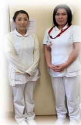
←認知症看護認定看護師

《精神療養病棟》 長期療養されている患者様の精神的・身体的ケアをしながら、個々に合わせた社会復帰に向けてのリハビリや退院支援に取り組んでいます。